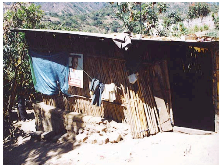
jetzige Wohnverhältnisse